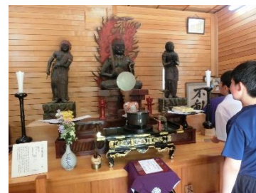
【永寿寺住職さんの講話】