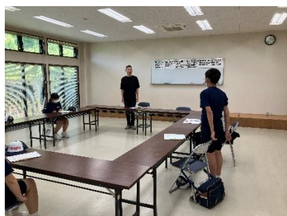
【窯元会館 始めの挨拶】